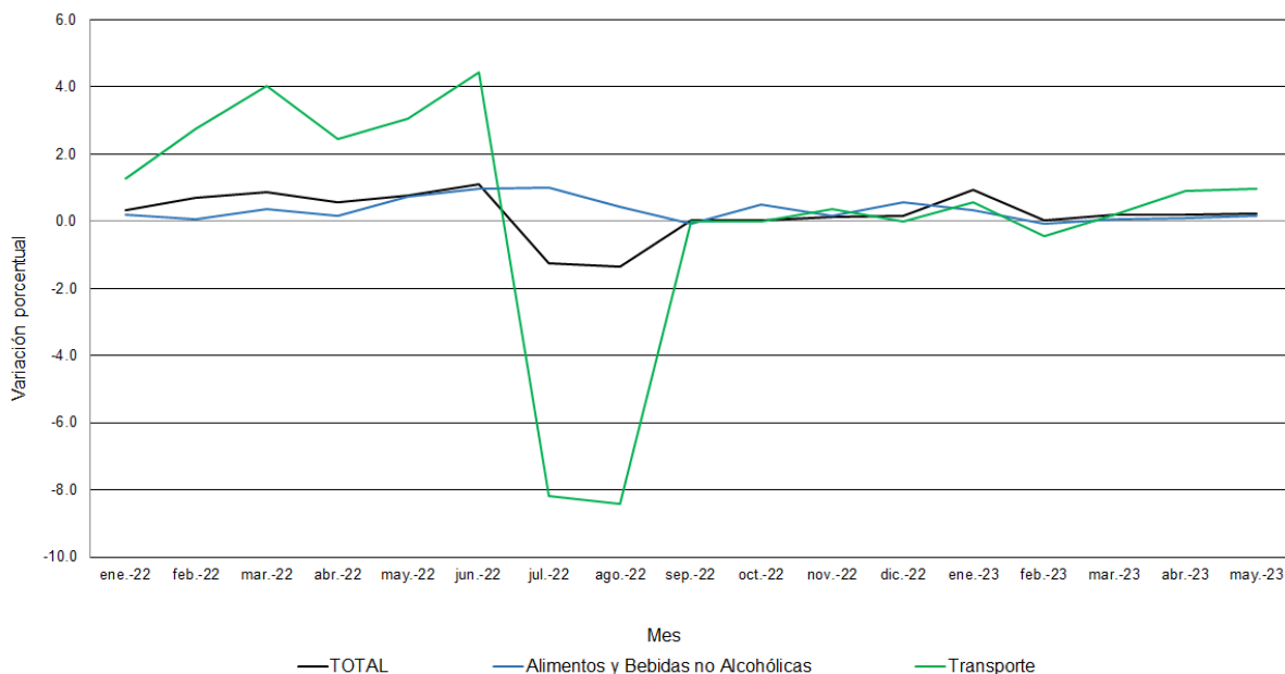
CUADRO 2. EVOLUCIÓN DE LA VARIACIÓN DEL ÍNDICE DE PRECIOS AL CONSUMIDOR NACIONAL URBANO, SEGÚN GRUPO DE ARTÍCULOS Y SERVICIOS: DE ENERO A MAYO DE 2023